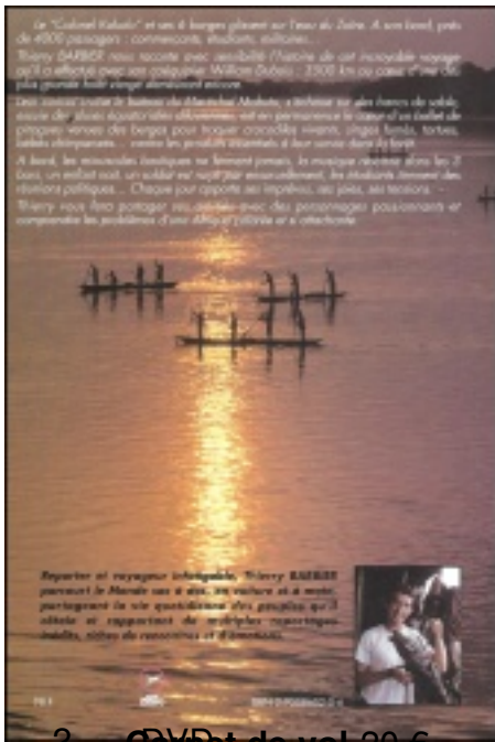
2. DVD de vol 20 €