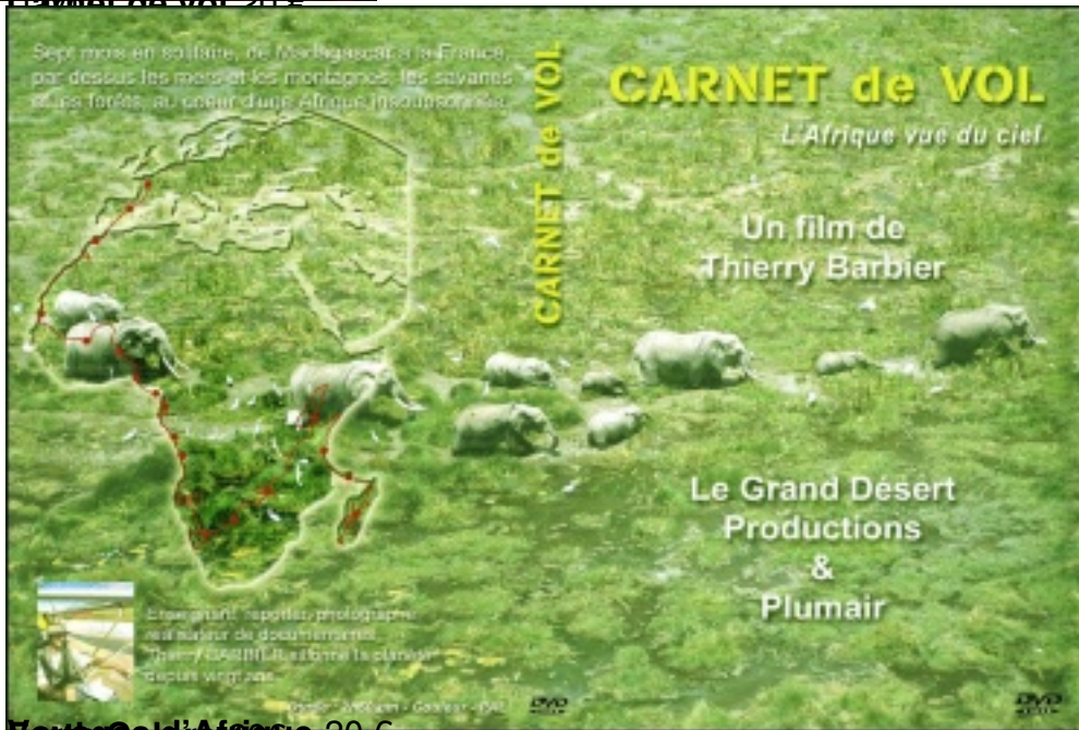
Voyage en Afrique 20 €