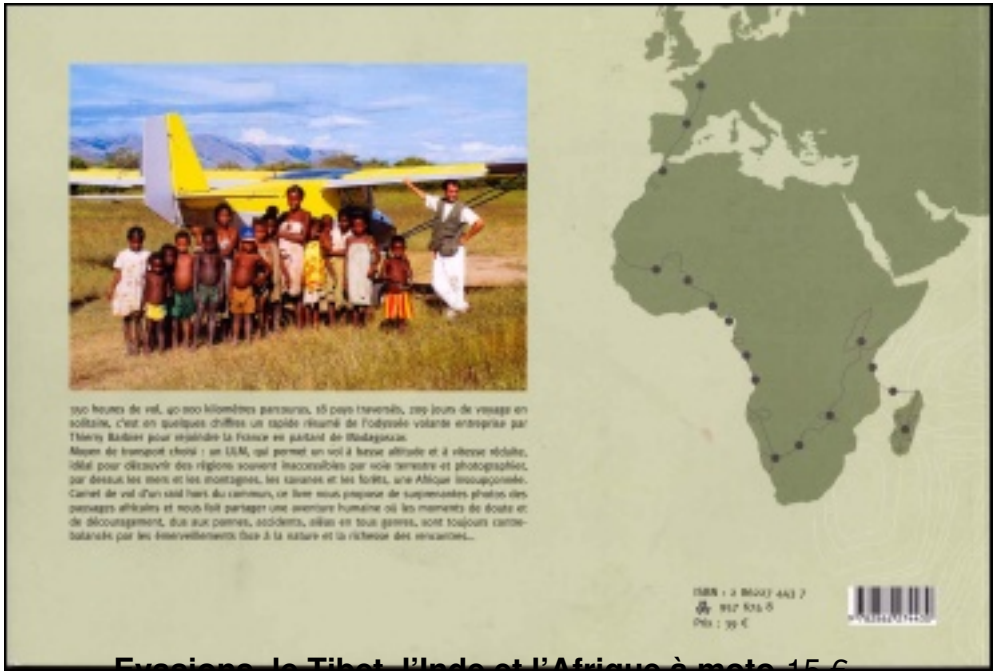
Évasions - le Tibet - l'Inde et l'Afrique à moto 15 €